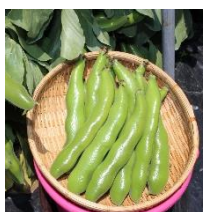
松山一寸ぞらまめ