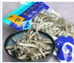
瀬戸内の銀鱈煮干し