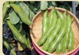
松山一寸そらまめ