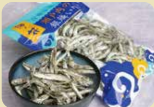
瀬戸内の銀鱈干し