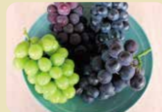
伊台・五明こうげんぶどう