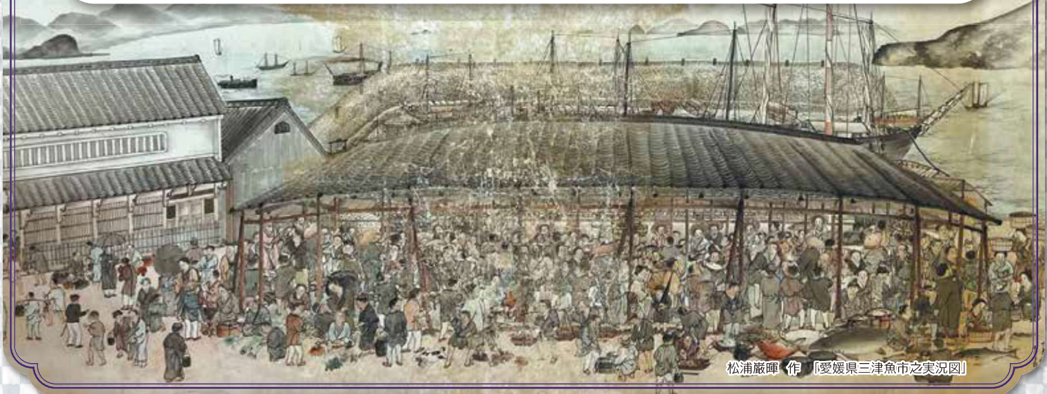
松浦巖暉 作 「愛媛県三津魚市之実況図」