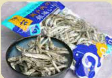
瀬戸内の銀鱈煮干し