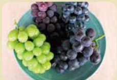
伊台・五明こうげんぶどう