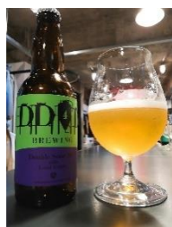
・クラフトビール (伊台・五明こうげんぶどう)