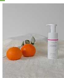
・ハンドソープ (紅まどんな)