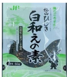
・白和えの素 (松山ひじき)