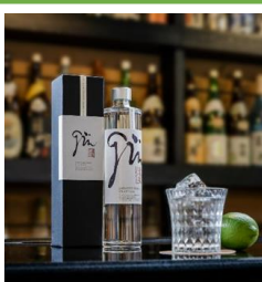
・ジン (紅まどんな)