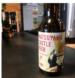
・クラフトビール (伊台・五明こうげんぶどう)