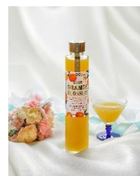
・ジン (カラマンダリン)